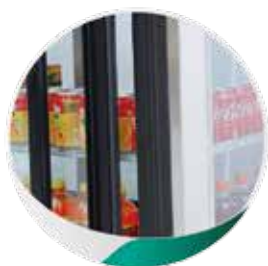
Portes en PVC double vitrage anti-buée