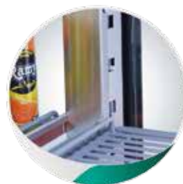
Étagères en PVC alimentaire réglables en hauteur