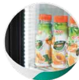
Éclairage en LED économique