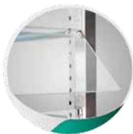
Possibilité de portes battantes en plexyglass