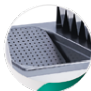
Bac GN 1/1 H200 avec égouttoir