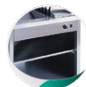
2 Etagères de rangement