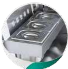
MNC12 : Bacs à ingrédients