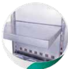
MNC12 : Etagère en inox pour appareil à panini