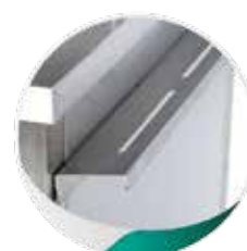
MNC12 : Rangement pour ustensiles