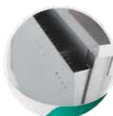
MNC12 : Rangement pour torchons et sacs à sandwichs