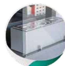
MNC80 : Bacs à ingrédients