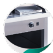
Régulation de la température