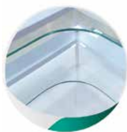
Etagère de coin arrondi