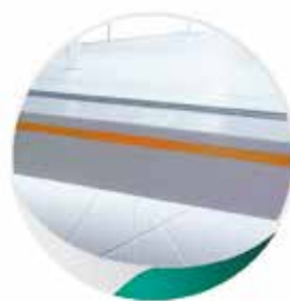
Retro-éclairage de façade en LED