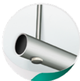
Barre pendoir en inox alimentaire