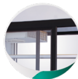
Deux portes en PVC avec double vitrage