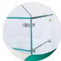
02 étagères en verre