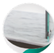
Surface d'exposition en Marbre