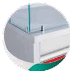
Surface d'exposition en inox