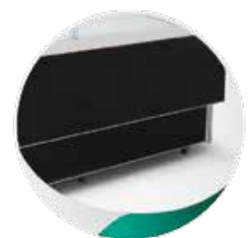
Revêtement extérieur en MDF