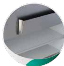
Réserve neutre avec porte ustensiles