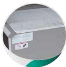
Table de travail en marbre